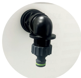
Nez de remplissage