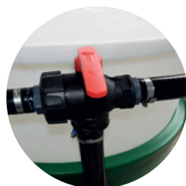
Vanne 3 voies de brassage/ remplissage