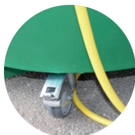
Roulettes avec frein