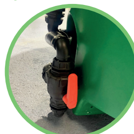
Vanne aspiration 3 voies